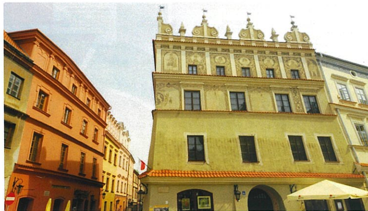
Sur la grand'place du vieux Lublin, les maisons des riches patriciens.

Une "élite" douteuse vient s'y installer : les SS, qu'on envisageait, une fois la guerre gagnée, de convertir en agriculteurs exploitant les terres confisquées aux Polonais. Y viennent aussi 24 500 Volksdeutschen , c'est-à-dire des Allemands vivant dans des pays non administrés par des compatriotes, comme ceux de Pologne, de Tchécoslovaquie